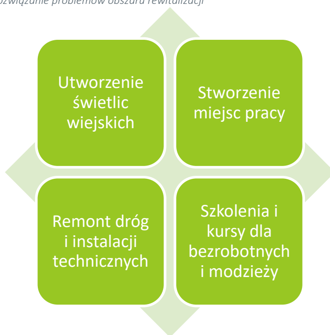
Rysunek 4 Pomysły na rozwiązanie problemów obszaru rewitalizacji

By zniwelować problemy techniczne uczestnicy spotkania zaproponowali remonty dróg gminnych i powiatowych oraz utworzenie sprawnie działającej kanalizacji deszczowej i melioracji. Ponadto, poprawie powinien ulec stan części budynków, szczególnie tych wybudowanych przed 1970 rokiem.