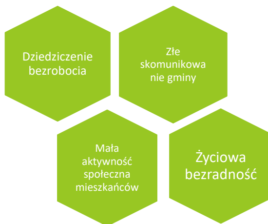
Rysunek 1 Problemy gminy Dygowo

Mieszkańcy wymienili także problemy specyficzne dla poszczególnych miejscowości .