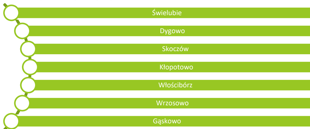
Rysunek 2 Miejscowości najbardziej zdegradowane

Mieszkańcy zostali także poproszeni o opis zjawisk negatywnych występujących na obszarze rewitalizacji . Ich zdaniem, jednym z głównych problemów jest starzenie się społeczeństwa. W gminie rodzi się coraz mniej dzieci, zaś osoby młode wyjeżdżając do szkoły czy na studia, decydują się w końcu na przeprowadzkę do większych miast. Oprócz zjawiska starzenia problemem jest więc także migracja ludzi młodych oraz wyludnianie się gminy. Problemem obszaru rewitalizacji, podobnie jak problemem całej gminy, jest złe skomunikowanie obszaru gminy, przez co mieszkańcy Gąskowa, Świelubia, Włóściborza, Miechęcina, Stramniczki i Stojkowa mają problem z dojazdem do zakładów pracy i szkół zlokalizowanych głównie w Kołobrzegu, Ustroniu i Białogardzie.